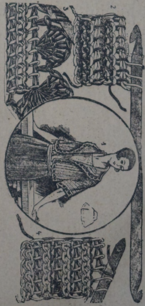
BOLERO DE LANA HECHO AL CROCHET. 2, 3 Y 4. DETALLES DEL T EJIDO